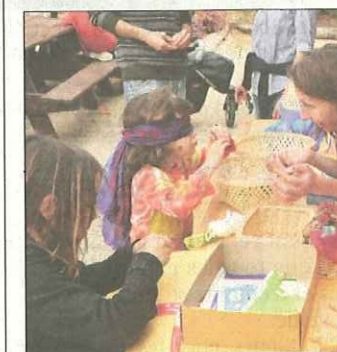
Des jeux pour les enfants.