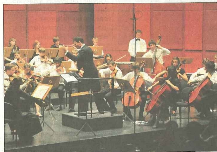
L'Orchestre des collèves et des gymnases lausannoises en concert.